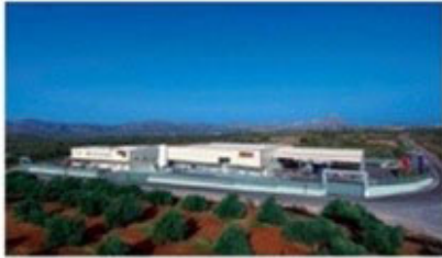
Central facilities – Factory in Chania – Crete- Greece