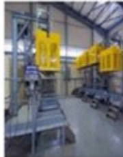
Gas Bottling Unit