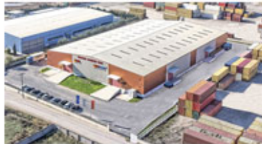
Warehouse in Thessaloniki - Greece