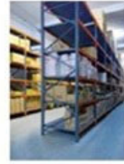
Warehouse in Crete