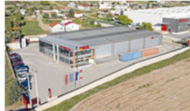
Warehouse in Athens - Greece