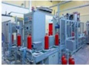
Automatic Production Line