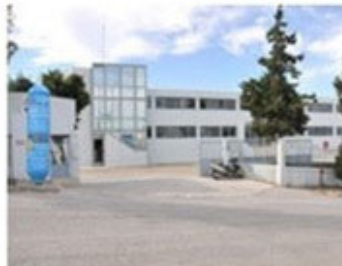
Warehouse in Heraklion - Crete