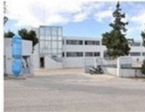
Κέντρο Διανομής Κεντρικής & Ανατολικής Κρήτης (ΒΙ.ΠΕ. Ηρακλείου, Κρήτη)