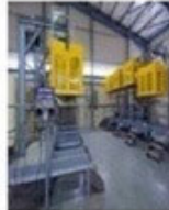
Μονάδα Αυτόματης Εμφιάλωσης Αερίων