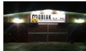
Παράρτημα στα Βαλκάνια (Σκόπια)