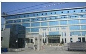
Εγκαταστάσεις στην Κίνα