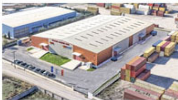
Κέντρο Διανομής Βορείου Ελλάδος & Βαλκανίων (Ιωνία, Καλοχώρι, Θεσσαλονίκη)