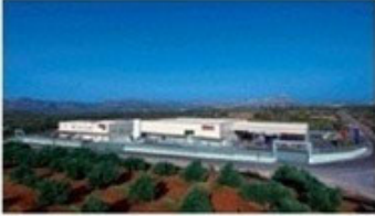
Κεντρικές Εγκαταστάσεις στα Χανιά της Κρήτης (Περιοχή Καθιανά, Ακρωτηρίου)