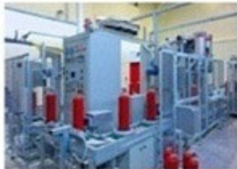
Στάδια Παραγωγικής Διαδικασίας