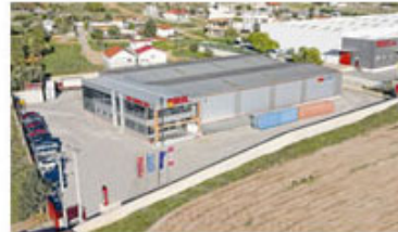
Κέντρο Διανομής Κεντρικής, Νότιας & Νησιωτικής Ελλάδος (Ασπρόπυργος, Θέση Νέα Ζωή, Ατική)