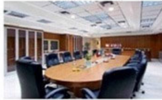
Αίθουσα Συνεδριάσεων - Έκθεση Προϊόντων