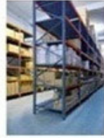
Αποθήκη Πρώτων Υλών & Ειδών Εμπορίας στην Κρήτη